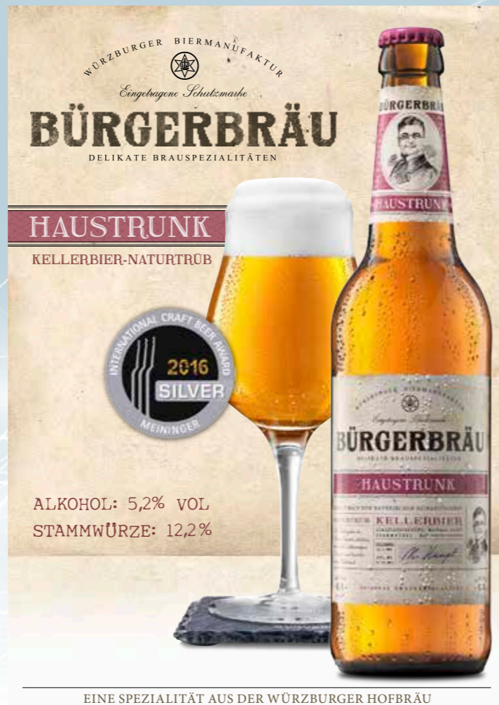
EINE SPEZIALITÄT AUS DER WÜRZBURGER HOFBRÄU